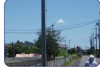
⑨2014年8月3日12:40茂原市東郷・南・積雲？