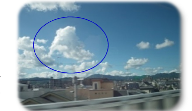
⑩2014年9月13日 新幹線車窓大阪京都間・北西・積雲

◎文中に記す地震は、写真の雲を地震雲と特定するものではなく、風の流れを肌で感じる事が、感受性を養う上で大切ということです。何気ない風景は大自然の産物であると心得ておきたいものです。