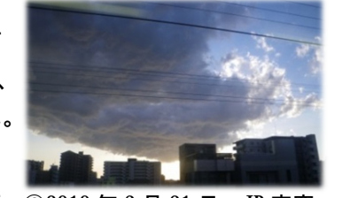
⑥2010年3月21日・JR車窓本千葉付近・南西・層積雲？乱層雲？冬の積乱雲？

⑨ぽっかり宙に浮いた富士山型の雲一つ。周囲に多少の雲はありましたが、①にも似たような状態でおやっ？と感じさせるものがありました。同日16:30中国雲南省魯甸(ろでん)でM6.5の地震が発生しています。