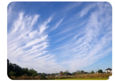
④2014年11月18日・長生郡長柄町榎本・南・巻雲？

③一見、翼を広げた不死鳥の舞か天に昇る竜を連想させるような壮さ。その美しさに何回もシャッターを押したほどです。直近では9月22日小笠原諸島でM6.4の地震、9月27日御嶽山噴火が発生しています。