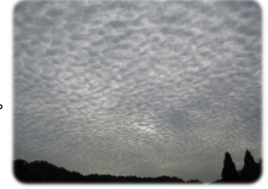
②2009年11月16日・長生郡長南町役場周辺・頭上・高積雲？

②見渡せば果てしなく空一面のひつじ雲。12月27・28日伊豆半島東方沖でM6.3震度5弱を観測した地震と何か因果関係があるのでしょうか。何とも奇怪な雲でした。