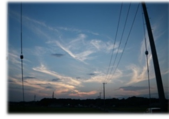
⑦2010年6月30日・茂原市小林・西・巻雲