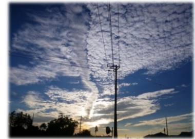
③2014年9月21日・茂原市東郷・西・巻積雲と何か別種の複合？

①今までの最もインパクトの強かった雲。当日は見渡す限り雲一つない青空の中に、この雲だけがぽつんと一つ。左下の僅かな突起はポケットからカメラを出す十数秒の間にできたもので、発見した瞬間は殆ど長方形！この日の40日後東日本大震災が発生したことを考えると、異変を暗示していたかもしれません。