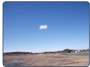
①2011年1月30日・茂原市上茂原・西・雲種は積雲か？

①今までの最もインパクトの強かった雲。当日は見渡す限り雲一つない青空の中に、この雲だけがぽつんと一つ。左下の僅かな突起はポケットからカメラを出す十数秒の間にできたもので、発見した瞬間は殆ど長方形！この日の40日後東日本大震災が発生したことを考えると、異変を暗示していたかもしれません。