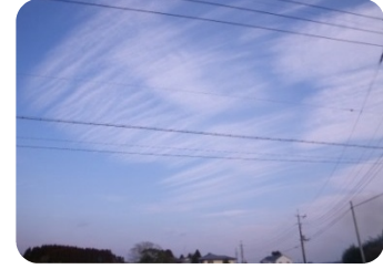
⑤2010年1月31日・長生郡陸奥沢町上之郷・北東・巻雲？

④シダの葉あるいは連なる杉の葉の形にも似て、何となく楽しそう。爽快感を漂わせると共に、筋状に流れる様子はアニメ等で強風を現す図柄をもイメージさせられます。胸騒ぎを覚えた中、4日後の11月22日に長野県北部地震M6.7発生は偶然でしょうか。