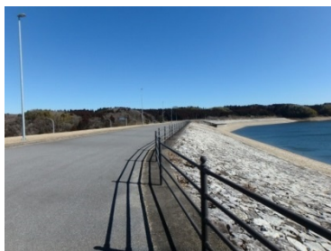
長柄ダム堤上 左が放水路側

ちょっと蛇口を捻れば安全な飲料水が潤沢に供給できる、水資源に恵まれインフラ整備がこれほど行き届いている日本のような国は他にそうないようですが、当たり前の生活基盤は、裏方の壮大な事業に支えられています。