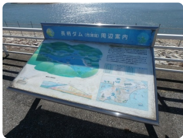
長柄ダム(市津湖)周辺案内看板。当施設の規模構造も記されている。

農業土木課程高等学校就学時(1980年頃)のこと。科目農業水利の授業で「(当地)茂原の水道は日本一うまいとされている」という少々大袈裟とも思える話を耳にしました。当時市内の生活水は長柄の山の湧水が長柄浄水場を経て供給されており、その水質の良さは抜群だったようです。1985年(昭和60年)に『長柄ダム』が完成し現在では、長生郡市殆どの地域が、利根川から引かれ当ダムに貯留された水を、前述浄水場を経て供給されています。