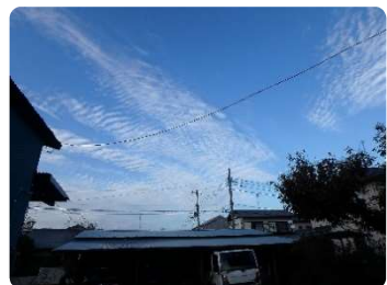
③2017年11月3日 自宅にて 北 巻雲か巻積雲か?