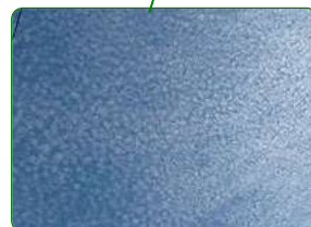
⑥2018年5月12日・茂原市本納・西・巻積雲