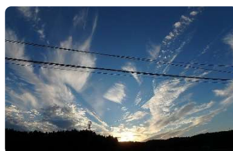
②2016年10月14日・大網白里市小中・南西・巻雲、巻積雲他

⑤菱形に近いほぼ同形の雲が4~5つ一列に並んでいるところが何とも妙趣。その一つは羽毛のような風合いで温かみを覚えます。天候は風もなく極穏やかで自転車走行中しばらくの間この光景が続きました。