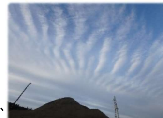
⑧2018年12月7日・茂原市新治・北東・層積雲