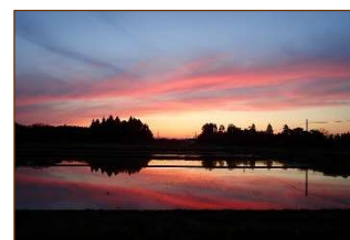
⑩2019年5月2日・茂原市内

⑥肌理細やかな粒状は実に煌びやか。188号でも紹介した(鳥の羽ばたく様のもの)とおりこの種の雲にはたびたび出会いますが、今までの中で最も粒が小さく見え、壮美で宝石を鑲めたようでもあります。