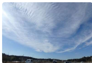
④2017年12月26日 長柄町役場にて 南西から直上巻層雲、層積雲

①お客様宅の庭先にて発見。ソフトクリームのように、一見ユーモラスではあるもののおそらく積乱雲。発達すれば猛威を振るう種。動物にも見た目可愛く実は擻擻というのがありますね。(笑)