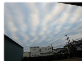
⑦2017年11月26日・自宅にて・南から直上・層積雲