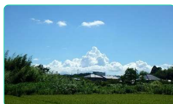
①2016年7月30日・長柄町榎本・南・積乱雲(わた雲)