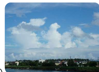
⑩2018年9月9日・長生郡一宮町・東・高積雲、積乱雲