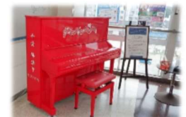
駅構内にあるストリートピアノ

勝浦駅では早速、漁師に見立てた魚? と雛飾りのディスプレイがお出迎え。ストリートピアノを置くお洒落さからも街の活力が窺えます。房総を開拓した天富命(あめのみこと)を祀る“遠見岬神社(とみさきじんじゃ)”は朝市の中心付近で、その参道石段を利用した“かつうらビッグひな祭り”は有名。境内は高台で勝浦市街地が一望できます。朝市では、海産物はもとより農産物や日用品、衣類、工芸品、グルメ関連などの露店が並び、その賑わいは活気象徴でしょう。