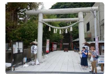
遠見岬神社(とみさきじんじゃ)一の鳥居前。鳥居の奥の“富咲の石段(とみさきのいしだん)”は“かつうらビッグひな祭り”の開催場所。