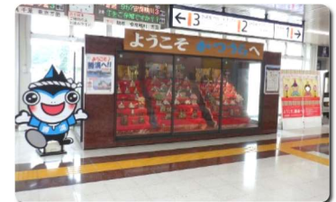
駅構内にある、漁師に見立てた魚? 雛飾りのディスプレイ

海流や地形の関係から、夏場の平均気温が軽井沢よりも低く、避暑地として注目を浴びている『勝浦』。鉄道アクセスも、都心から特急で90分弱、普通でも2時間強とさほど遠くなく人気のようで、移住されたあるいは移住を検討されている方も少なくないようです。