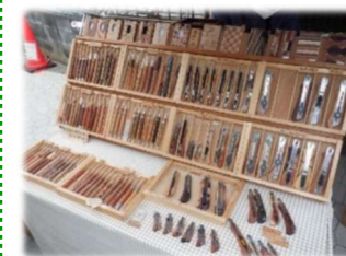
目に留まった工芸品店。カッターナイフを購入。柄の部分は黒檀