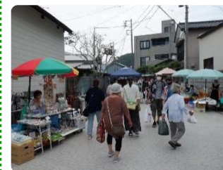
朝市の様子。来客には若い世代もあちらこちらに見られ活気がある。

中心部は漁港色の濃い街ですが見所は数多。登山ガイド『千葉県山』に掲載のハイキングコースを参考に、名所旧跡巡りとまちなみ散策を敢行。2021年8月16日に訪れた際は生憎の雨の中、神社巡りをメインにコース一巡。2度目の9月12日は観光スポットを交えて一巡。