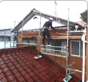
改修工事に足場架け作業の様子。文面の現場とは関係ありません。

災いは不意に襲ってくるもの。とはいえちょっとした注意を払えば防ぐことのできた事故。本年4月、屋根及び外壁工事現場での大工工事最終日のこと。筆者は現場監督兼大工。残りの屋根工事を応援の大工2名に任せ、11:45頃、切妻屋根の三角部分(通称「 やぎ 屋切り」)の外壁張り終了。屋根の進捗状況を確認し、屋根も15:00頃には完了し早々に引き上げられそうだと若干気持ちが高揚。これが災いの元。注意力散漫な状態となり、足元を確認せず何気なく一歩踏み出した次の瞬間、一段下の足場床板に転落(左下図)。利き腕の右肩骨折という重傷を負い、暫くの間会社休業を余儀なくされました。現在もりハビリ継続中で多少の休業補償を受けながらも、経営上支障