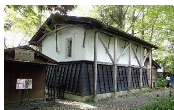
青柳家の屋敷内にある武家道具館