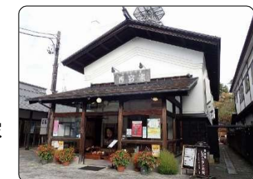
⑧西宮家店舗正面外観