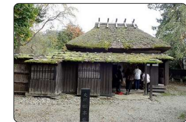
⑥松本家の正面外観