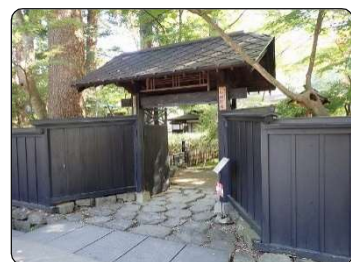
①小田野家の門構え

戦国時代などは日本の中で幾つもの国が存在し、それぞれの地域社会が形成されていましたが、その象徴が伝承された地域群が各地に保存されています。そこからは、当時の文化や世情・暮らしぶりなどが窺えそうです。