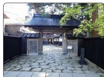
②河原田家の門構え