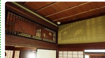
石黒家の欄間。裏側からの光で下がり壁に陰影が映る。