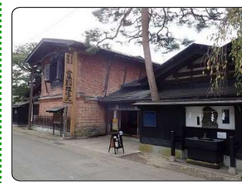
⑦安藤家の正面外観。奥に見えるのが煉瓦造蔵座敷