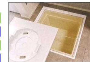
体組成計を外した状態 床下収納庫としても使用可能。パンフレットより