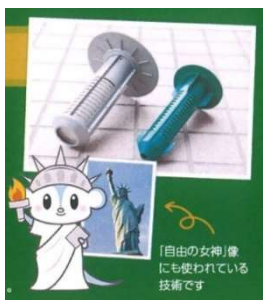
自由の女神にも採用。