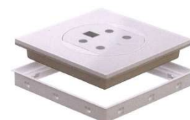
上が体組成計内蔵の蓋 下が床下点検口または床下収納庫外枠