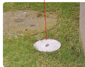
写真はインターネット三共消毒HPから